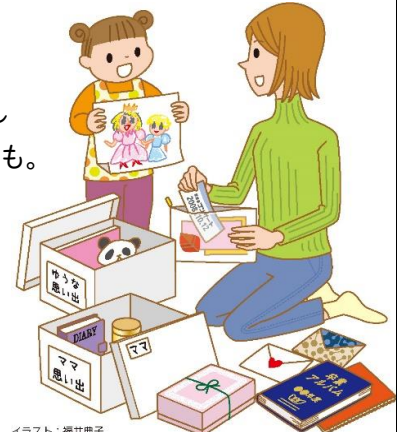
イラスト：福井典子

実物は処分するなど、思い出を残しつつ整理する方法も。上手に保管して、思い出と一緒に残しましょう。